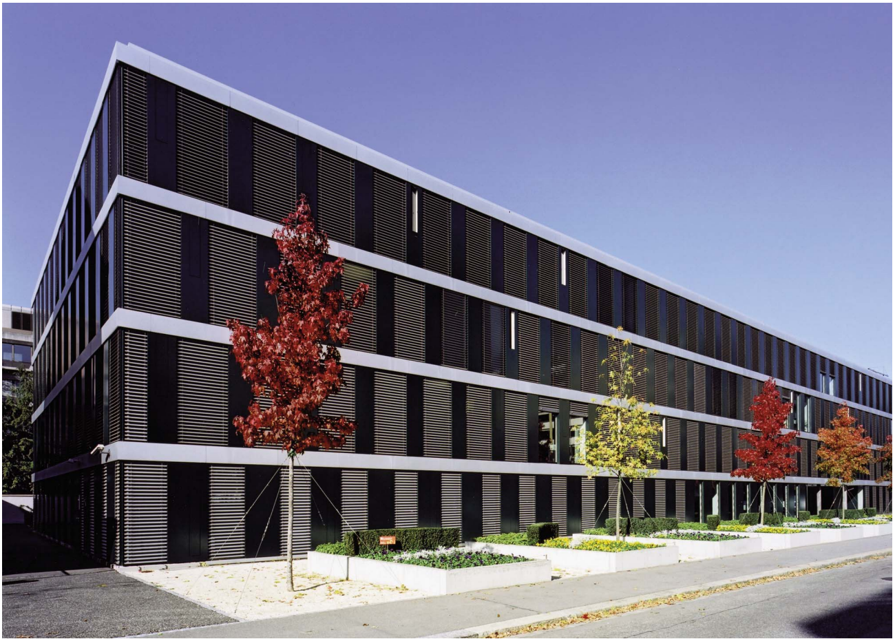
Geschäftshaus mit repräsentativer Architektur Lange Gasse Basel