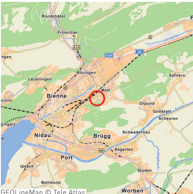
GEOLineMap © Tele Atlas

Sanierung von 141 Mietwohnungen in 3 1/2 Monaten